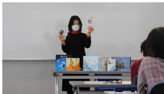
ブックトーク講座 (読み聞かせボランティアスキルアップ講座)

子どもたちが本に興味を持つ手法の一つである、テーマに沿って本を紹介するブックトークの講座を、学校などで活動経験豊富な方を講師に迎え全4回実施しました。講座では講義だけでなく、実習等も行ったことで、受講生はその魅力に触れることができました。受講後、ボランティア活動として続けていきたいという声があがり、グループを結成することにつながりました。