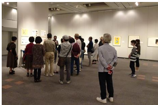
池田満寿夫 版画コレクション展2020 ギャラリートーク

新型コロナウイルス感染拡大防止のため、中止になった第12回版画ビエンナーレに代わり、版画芸術の振興および令和4年度開催予定の版画ビエンナーレに向け、出品者増をめざした、初代館長である池田満寿夫のコレクション展を行いました。大野城市が所蔵する素晴らしい作品を市民に公開できたことは、文化芸術の裾野を広げ、版画への興味関心の醸成に寄与することができました。