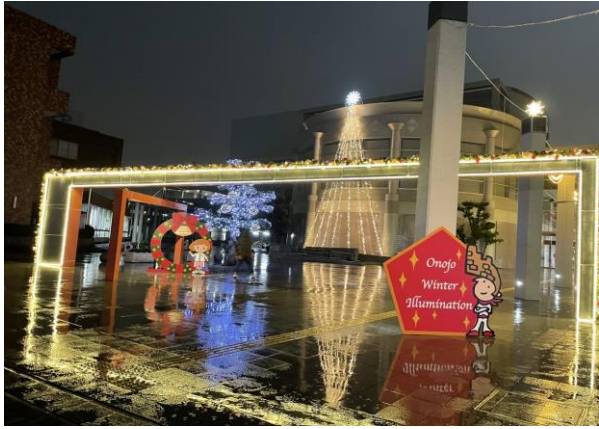
大野城ウインターイルミネーション

シビックゾーン連携イベント「大野城ウインターイルミネーション2020」では、新型コロナウイルス感染拡大防止のため点灯式等の実施は見合わせましたが、イルミネーションについては、新型コロナウイルス終息の願いをこめて点灯しました。