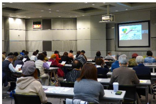
大野城市男女共生講座（第4回） Zoom活用

「大野城市男女共生講座」では、男女共同参画をベースに環境・家庭生活などの視点で講座を実施しました。新型コロナウイルス感染拡大の影響で、館外研修は実施直前に中止することとなりましたが、環境問題（SDGs）に関する講座では講師（つくば市）と、多目的ホールをZoomで結んで実施しました。新規受講生が増加する等、反応も良く講座運営の広がりにもつながりました。