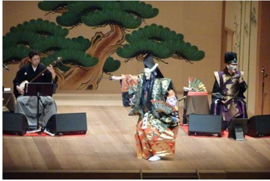
能舞音楽劇「義経記」

昨年度、新型コロナウイルス感染拡大防止のため延期をした能舞音楽劇「義経記」を能舞台版として上演しました。