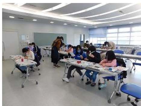
「図書館へゆこう！！2021年」 折り染めで作る読書ノート

「図書館へゆこう！！2021年」では、新型コロナウイルス感染拡大の影響により毎年行ってきた講演会が中止となりました。