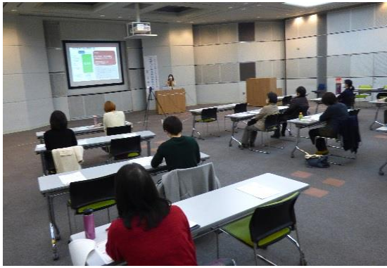
生き生きと輝く女性応援講座（第4回）

昨年度までの「地域女性リーダー育成事業」の成果と課題を受け、「生き生きと輝く女性応援事業」をスタートしました。