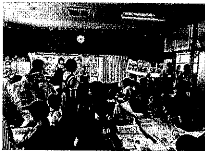
アスカラおでかけ教室