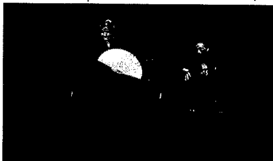
輝け!まどかぴあチャレンジステージ

新規事業として、市内で活動しているアーティスト等による公募型のステージイベント「輝け!まどかぴあチャレンジステージ」を開催しました。キャリアもジャンルも異なる4組の出演者による多彩なパフォーマンスに、会場からは大きな拍手が贈られました。