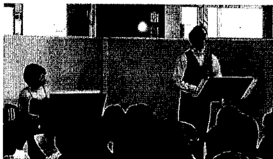
ティータイムコンサート

会場をギャラリーモールに戻しての開催となったティータイムコンサートは、様々な国や時代の作曲家に焦点を当て、4回の公演を実施しました。毎回立ち見が出るほど盛況で、通りすがりに足を止めて聴き入る人も多く見られました。