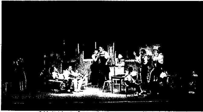
二兎社公演47「パートタイマー・秋子」

下半期には、コロナ禍では実施が難しかった大掛かりな演劇公演を2本上演しました。約13年ぶりとなる二兎社の公演「パートタイマー・秋子」では、文化庁の助成金を活用し、手頃なチケット料金で上質な舞台芸術を提供することができました。