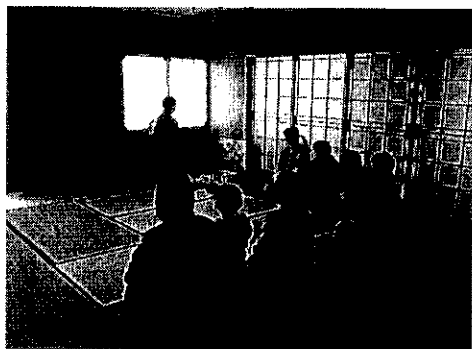
定期講座発表会 (3月) の様子

定期講座では多彩な新規講座を開講することができ、多くの方に学習の機会を提供しました。3月の発表会では、より見やすく親しみを持っていただけるようチラシを見直しPRしました。展示・体験・販売のコーナーや大ホールでの発表会も来場者でにぎわい、受講生は日ごろの成果を発表することができ、更なる学習意欲の向上へとつながりました。また、発表会に参加しない講座もデジタルサイネージを使って講座の魅力アピールしました。これからも多様化する市民ニーズにアンテナを張り、魅力ある講座を開催できるよう努めます。