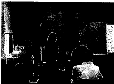
読み聞かせボランティアスキルアップ講座

地域や学校で読み聞かせボランティアの活動をしている方を対象としたスキルアップ講座を行いました。「誰もが楽しめるおはなし会の作り方」と題して近年増加している特別支援学級での絵本の選び方や特別支援とは何かについての講義がありました。小学校で長年係わっている講師の経験から、子どもの特性に合わせて、頭も体も使って楽しめるおはなし会にすることの重要さと大切さについての講義と本の紹介がありました。