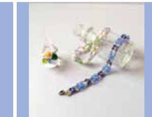
ビーズとフリーメタルのアクセサリー