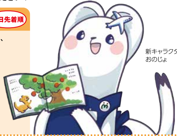
新キャラクター おのじよ