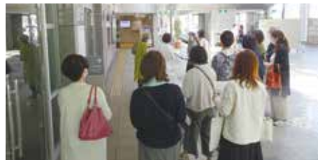
過去サポーター説明会(施設見学)の様子