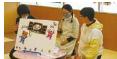
パネルシアターの様子

わらべうた、絵本の読み聞かせ、親子あそびなど0歳から参加できます。予約は不要です。どなたでもご参加いただけます。お気軽にお立ち寄りください。