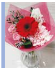
大人のためのフラワーアレンジメント

体験 15日(土)・16日(日) ※材料がなくなり次第終了 ※写真はイメージです