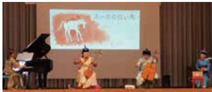
※令和4年度実施の様子

内容 2年生:音楽と朗読 4年生:民族音楽/身体表現(ダンス) 6年生:ホール体験(狂言鑑賞)