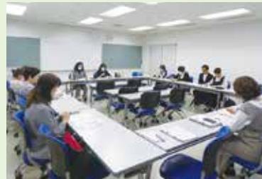
実行委員会開催風景

年間を通して、ゲストの人選や準備、フォーラム当日の進行など、イベントの企画・運営に関する全般に携わります。