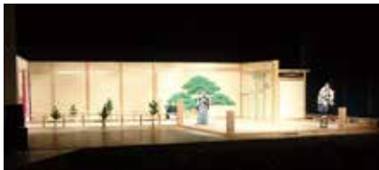
※令和4年度実施の様子

● 身体表現(ダンス) …からだを動かす楽しさを体験します。日常の何気ない動作や準備運動が“ダンス”に生まれ変わります。