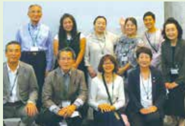
大野城市男女共生講座実行委員

講師の人選や準備、講座当日の進行、まとめの報告書「出会い」づくりなど、講座の企画・運営に関する全般に携わります。