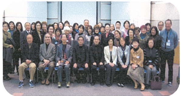
「袖振り合うも多生の縁」 最後は参加者全員で「はい！チーズ」

すてっぷを手にした老若男女、みんな揃ってこの指とおまれ！（情報サポーター 山口 郁子）