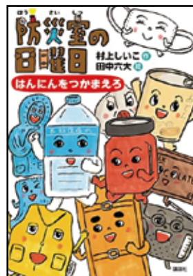
▲「防災室の日曜日」(講談社)